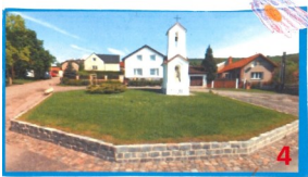
KAPLE SVATEHO VÍTA