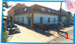
Hospoda u Misíků