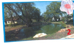
Řepništěk a kapličky