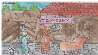
Zajíčková D., 5. A