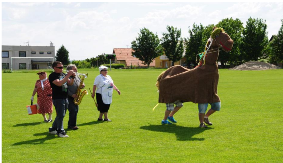
Masopust v Čejeticích