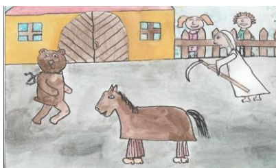
Solníčková B., 5.A