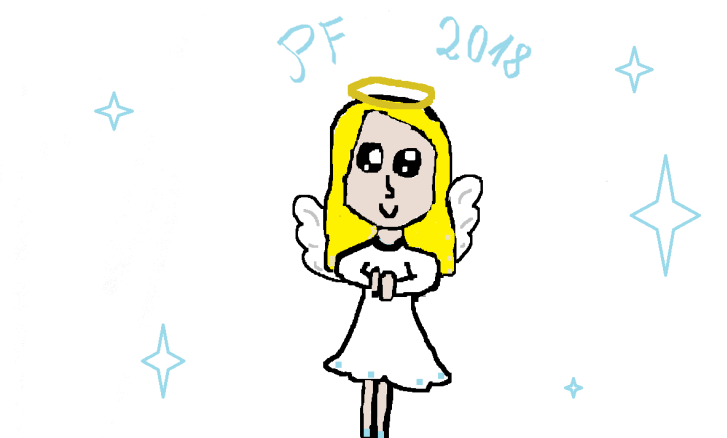
ZŠ Mladá Boleslav Komenského náměstí 91